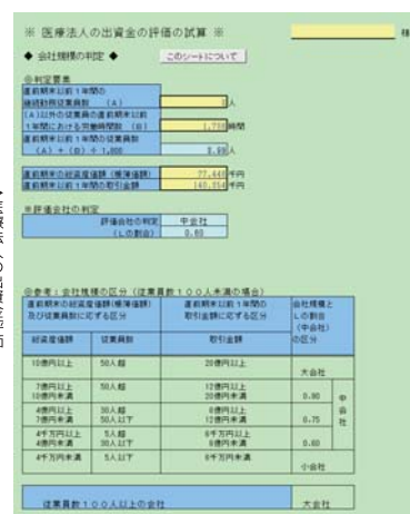
▲医療法人の出資金評価