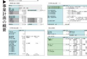
▶現金収支予想グラフ