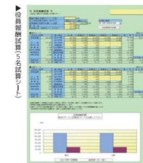
▶役員報酬試算5名試算シート