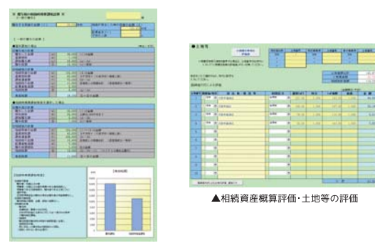
▲贈与税の相続時精算課税試算(一般)